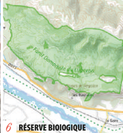
6 RÉSERVE BIOLOGIQUE