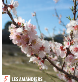
5 LES AMANDIERS