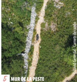
5 MUR DE LA PESTE