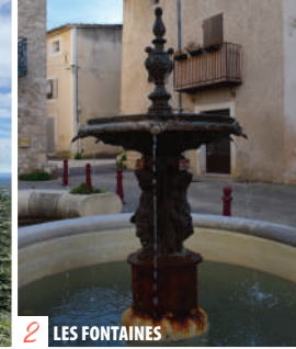
2 LES FONTAINES