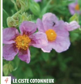
4 LE CISTE COTONNEUX