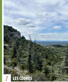
1 LES CÈDRES